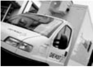
Die Post: Vorreiterin bei der Gleichwertigkeitsanerkennung von Diplomen.