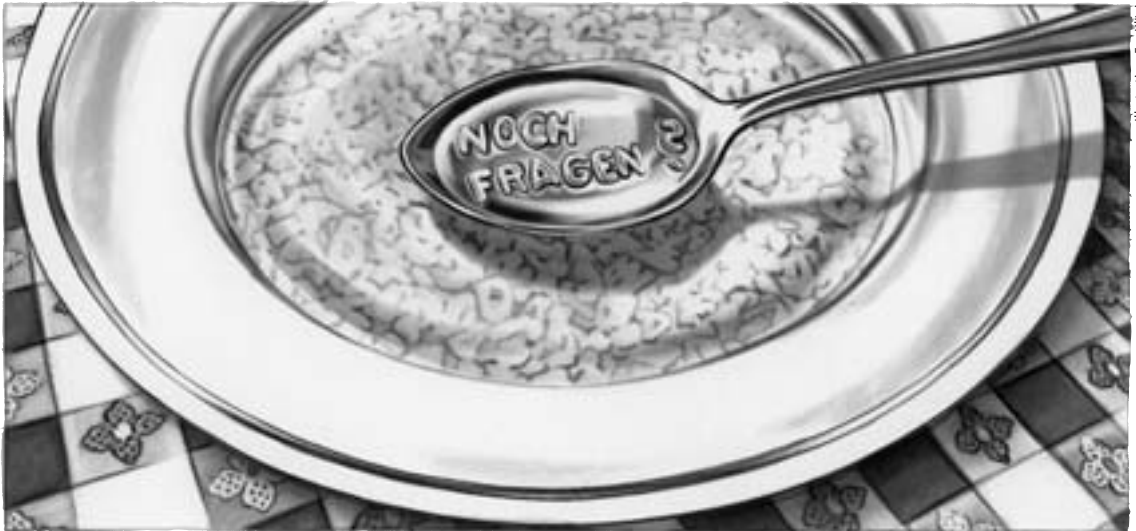
Illustration: Eva Kläui