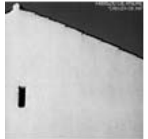
Fabrizio de André Creuza de Mä, 2005

Singen. Zufällig bin ich in einem kleinen Laden auf einen Schatz aus längst vergangenen Zeiten gestossen: Fabrizio de André, eine eigentliche Jugendliebe. Fabrizio de André, der leider bereits verstorben ist, war einer der bedeutendsten Cantautore der Nachkriegszeit. Bei ihm finde ich alles, was mein Herz begehrt: Poesie, Witz, Trauer, Leichtigkeit, Träume und Alpträume, kontrastiert und begleitet von leisen, zarten Tönen, von wilden und energischen Rhythmen! «Creuza de Mä» zum Beispiel nimmt die Musik des ganzen Mittelmeerraums auf, mit Liedern im Genueser Dialekt. Im letzten Jahr ist eine neu abgemischte Version auf den Markt gekommen. So schön.