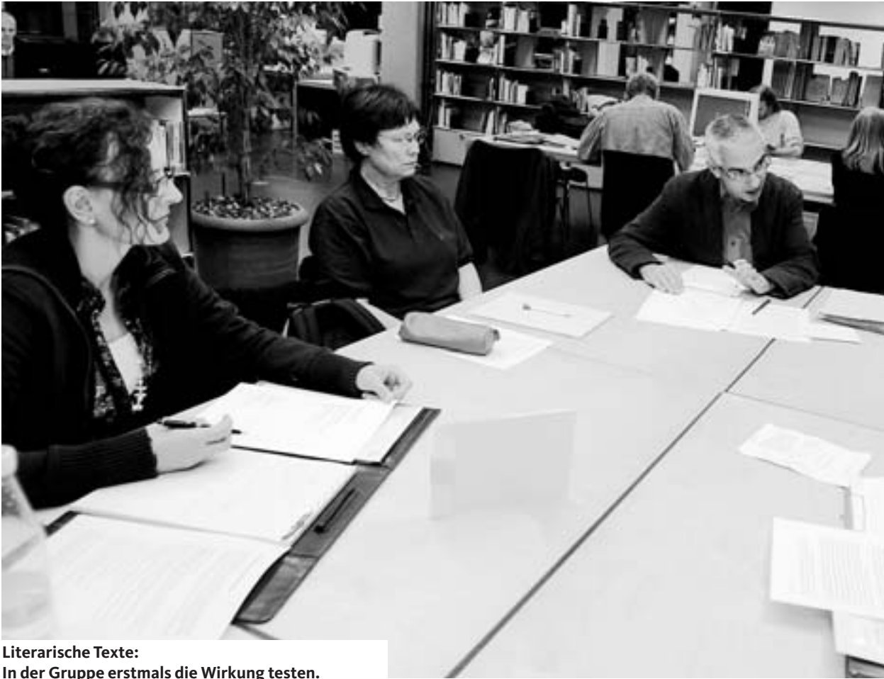
Literarische Texte: In der Gruppe erstmals die Wirkung testen.